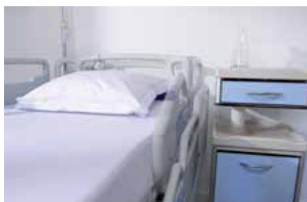
Bedhekken nemen slechts 4 cm van de ruimte naast het bed in beslag