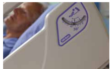
Eenvoudig af te lezen hoekindicators