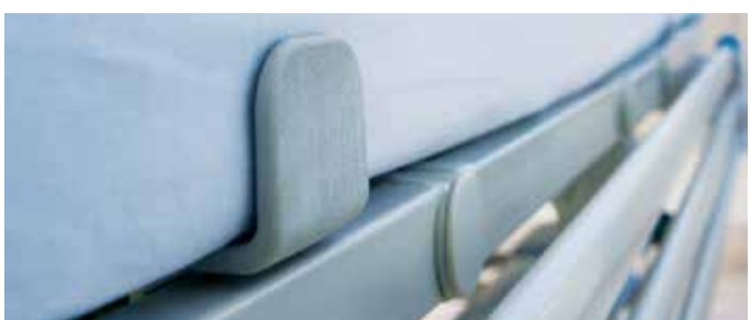
Het risico op beknelling van de patiënt verminderen Verstelbare matrashouders passen zich aan de breedte van het matras aan om het risico op beknelling van de patiënt te verminderen, zodat het bed aan verschillende oppervlakken kan worden aangepast.