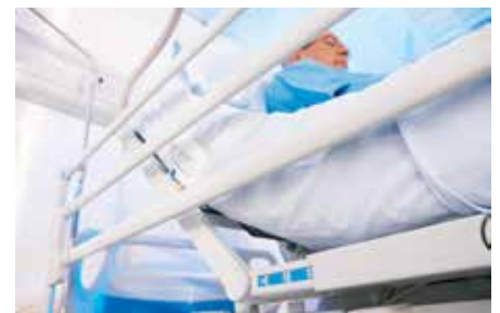
Line-Of-Site-indicator garandeert eenvoudige patiëntpositionering