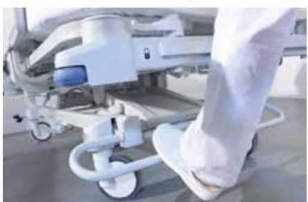
Remindicator (optioneel) Waarschuwt zorgverleners als de remmen niet correct zijn vastgezet.