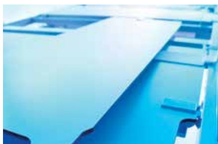
Eenvoudig te reinigen oppervlakken zorgen voor meer hygiëne