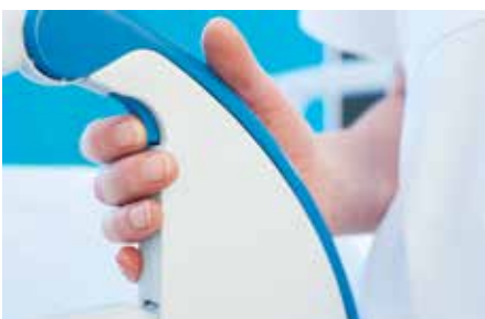
Dubbele vergrendeling verbetert de veiligheid