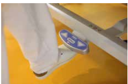
Tweezijdige voetbediening hoog-laag (optioneel)* Maakt handsfree bediening mogelijk.