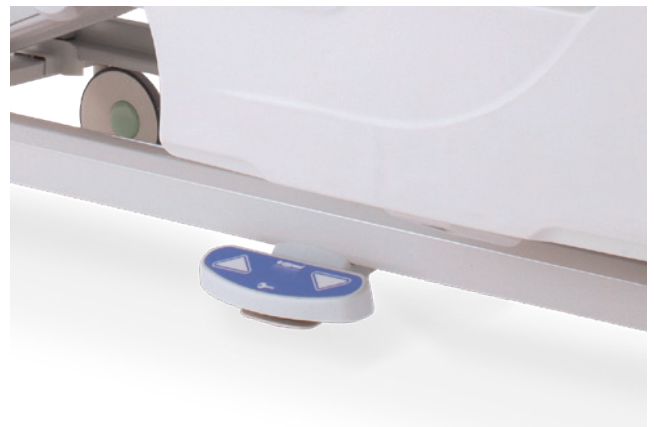
Optionele bilaterale voetbediening hoog-laag met automatische vergrendeling en vijfde stuurwiel