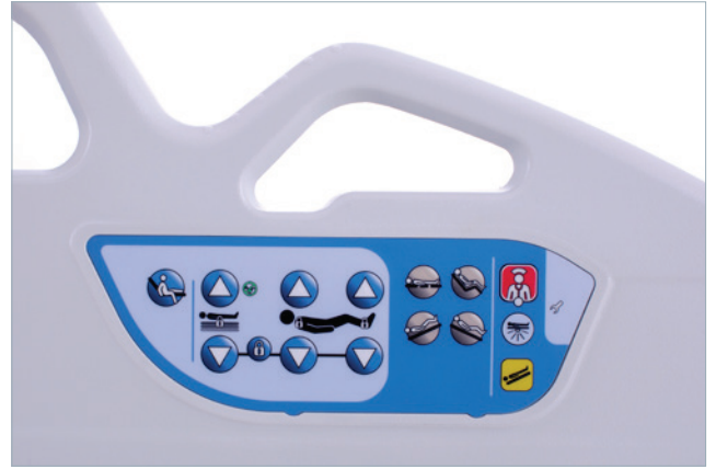
Indicator voor lage stand en positionering voor uit bed stappen met one-touch functie