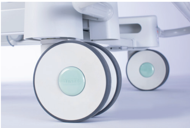
Optionele dubbele zwenkwielen van 125 mm**