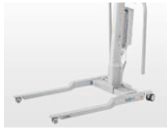
LowBase - hoogte onderstel