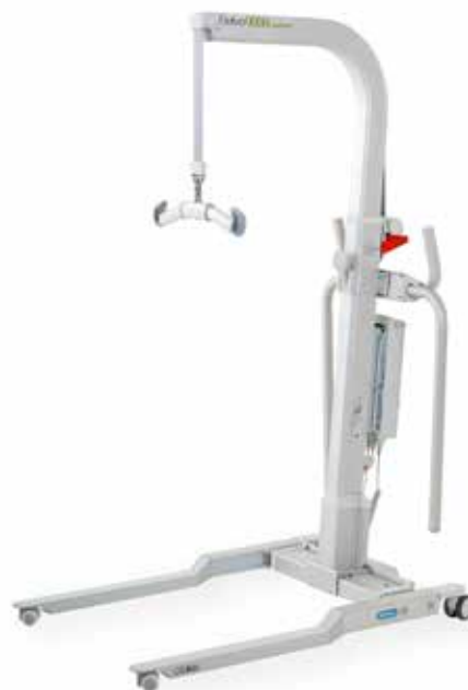
Golvo 9000 LowBase

De Golvo 9000-lift combineert de functionele voordelen van een plafondblift met de flexibiliteit van een mobiele lift. In combinatie met het uitgebreide aanbod aan Liko-accessoires is de Golvo-lift ideaal voor gebruikelijke tilsituaties in verschillende zorgomgevingen.